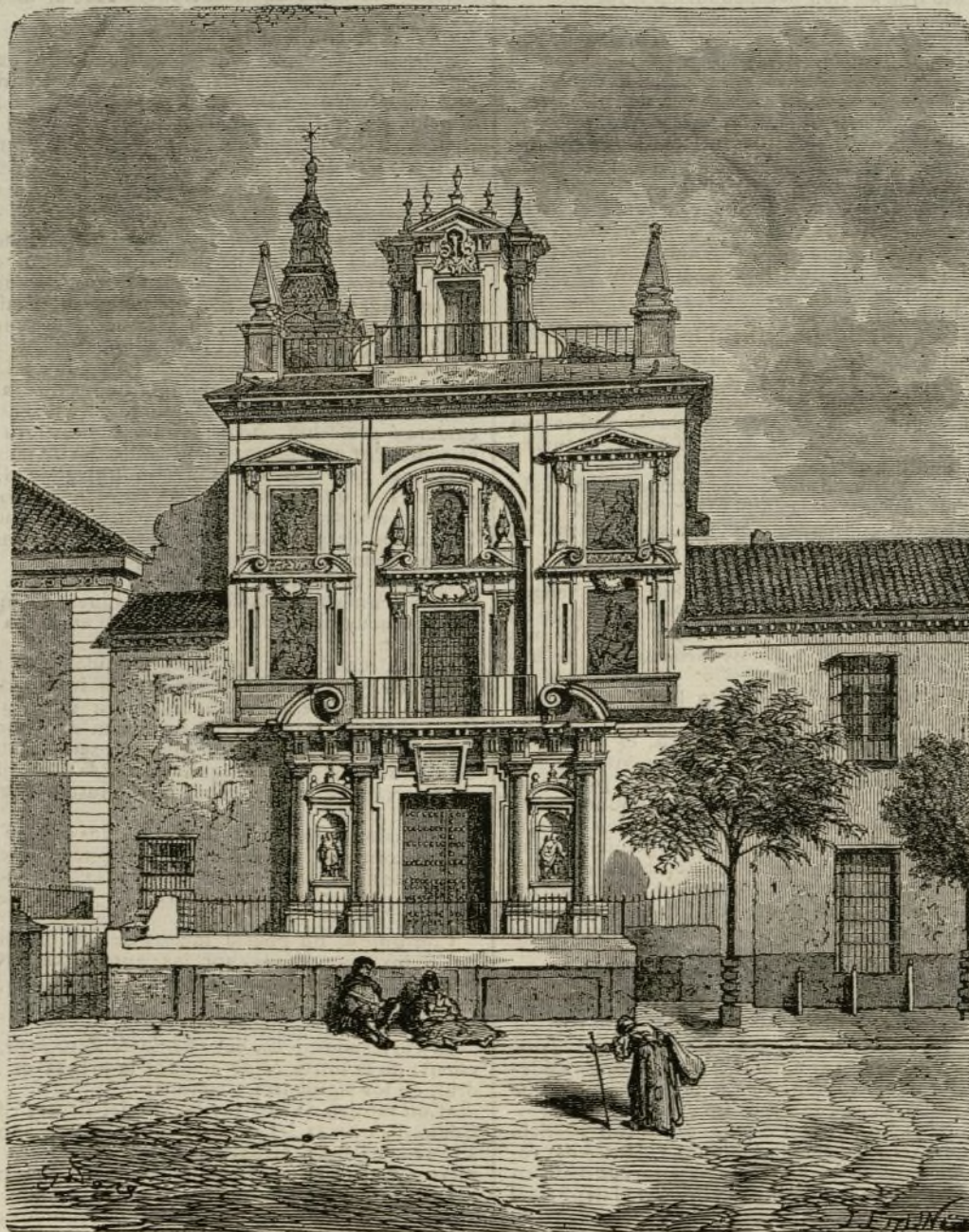
HOSPITAL DE LA CARIDAD EN SEVILLA.

Ahora bien, la dificultad más grave en Filosofía de la Historia , dificultad de que apenas se hace cargo el Sr. Barnés, es la de precisar de qué modo se ponderan entre sí estos elementos ó virtualida-