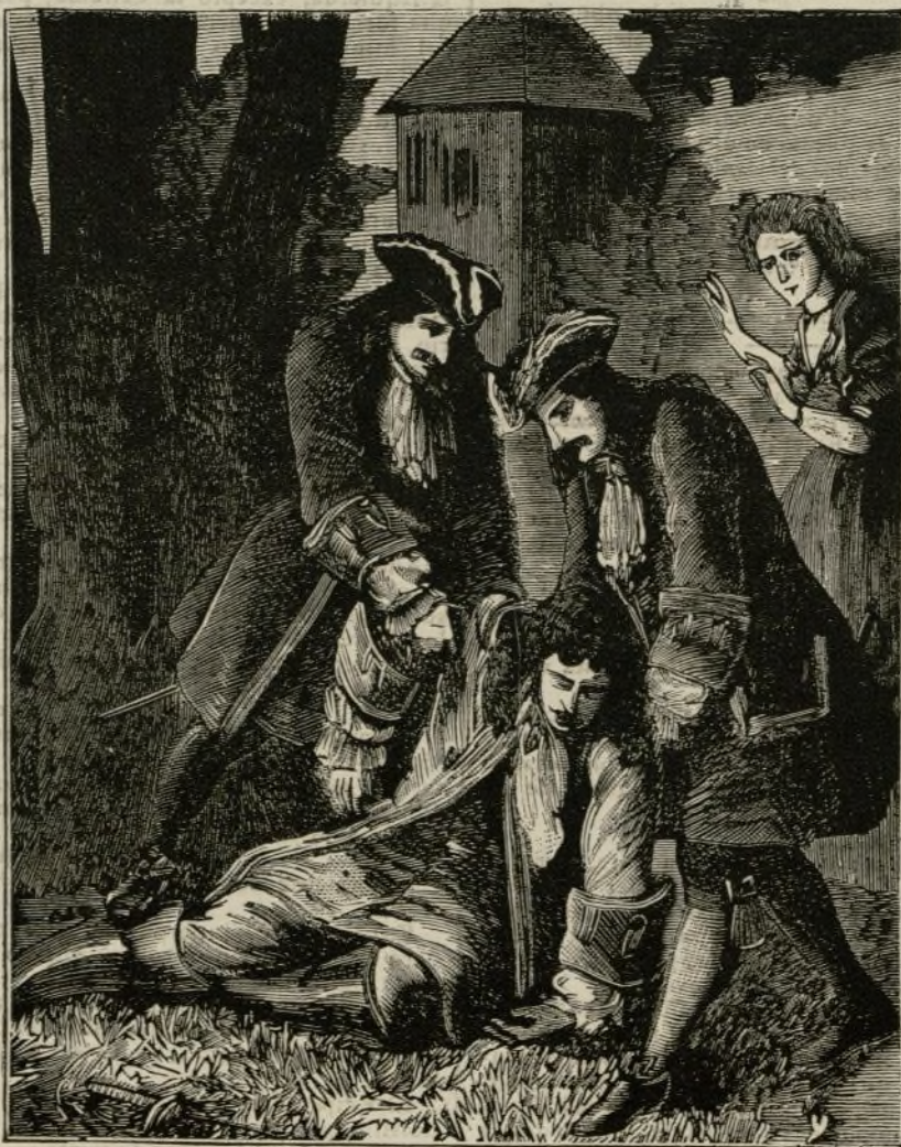
Los dos amigos trataron de levantar al herido. Ayuntamiento de Madrid

mismo veneno que ella me destinaba. Creyéndola muerta, me conceptuaba libre. Por esto he llegado á ser el marido de mi adorada Diana. Aquí en el Palacio del Regente es donde yo he encontrado viva á la infernal criatura, siempre la misma false-