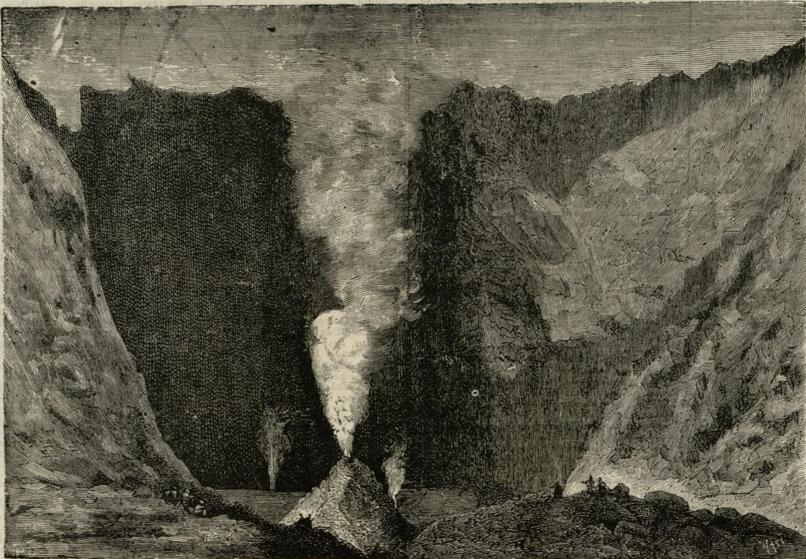
EL CRÁTER DEL VESUBIO. Ayuntamiento de Madrid