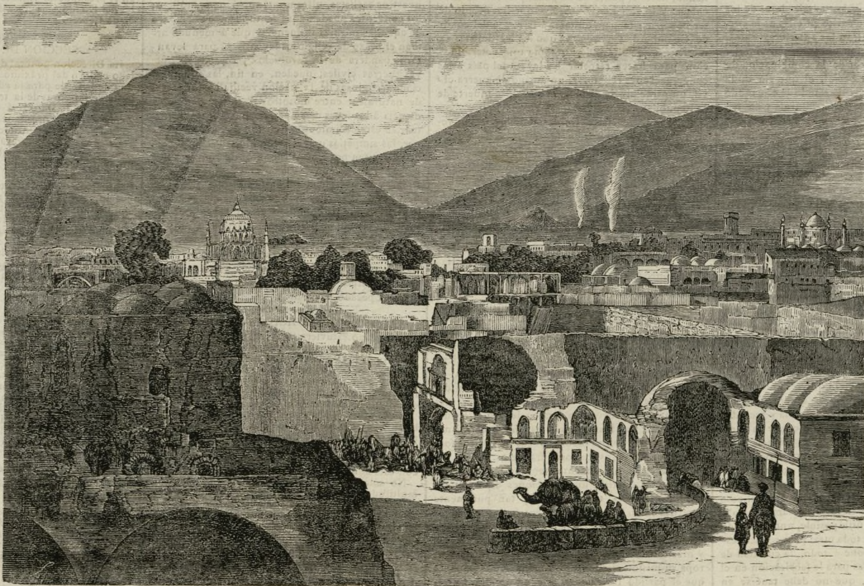
INTERIOR DE LA CIUDAD DE CANDAHAR.

Cañon Armstrong de 15 centímetros.—Peso, 4.056 kilogramos; longitud total, 4'20 metros; longitud del ánima, 3'96, 6 sean 26 calibres; carga, 16'98 kilogramos; proyectil, 36'24 kilogramos; velocidad inicial, 627'68 metros; potencia total, 731'46 toneladas-metro; potencia por centímetro de la circun-