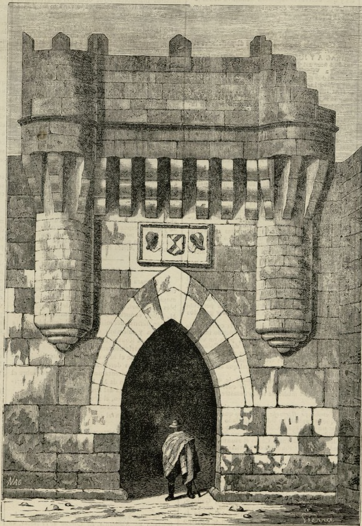
LA PUERTA DEL MERCADO EN HITA.

En tiempo de Fernando VII se quiso probar y se probó la aclimatacion del tabaco; los resultados que se obtuvieron fueron nulos; gastos inútiles, y por fin hubo que desistir de ella, pues aparte de algunas localidades en que se produce de muy mala calidad, no es esta planta á propósito para nuestros terrenos.