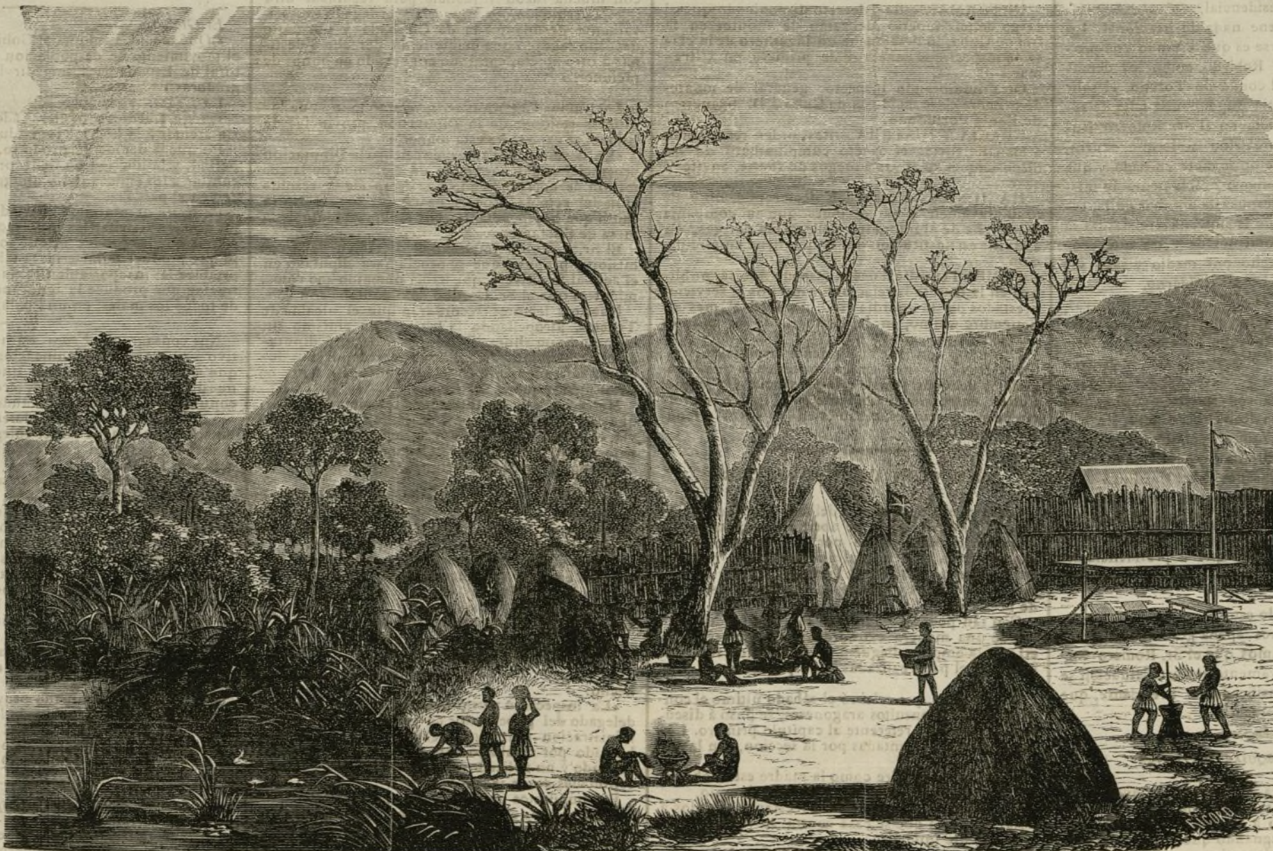
VISTA DE MEKETO (AFRICA CENTRAL).

Los hombres de la tribu á que corresponde Meketo están siempre dedicados á correrías co-