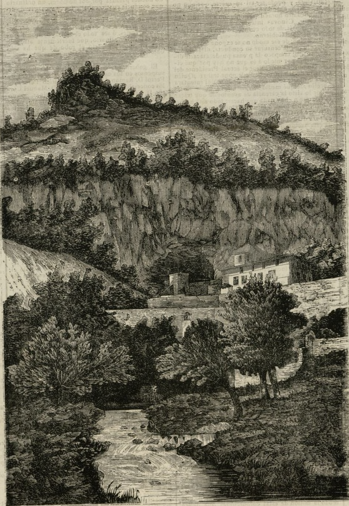
LA CUEVA DE COVADONGA.

Después, sabido es lo que ocurrió: empeñóse la lucha, ésta dió la victoria á los cristianos, murió la mayor parte del ejército de Alcama, murió este caudillo; fué preso y aun se cree que muerto don