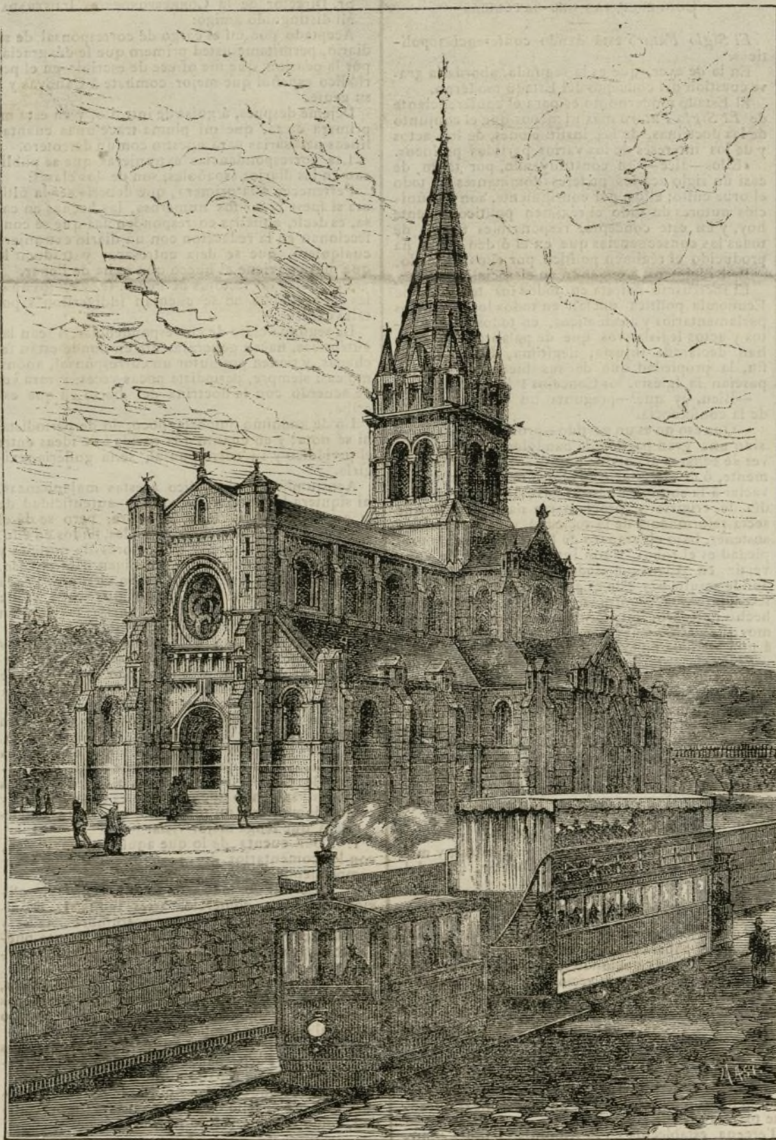
LA NUEVA CATEDRAL DE ROUEN (Francia.)