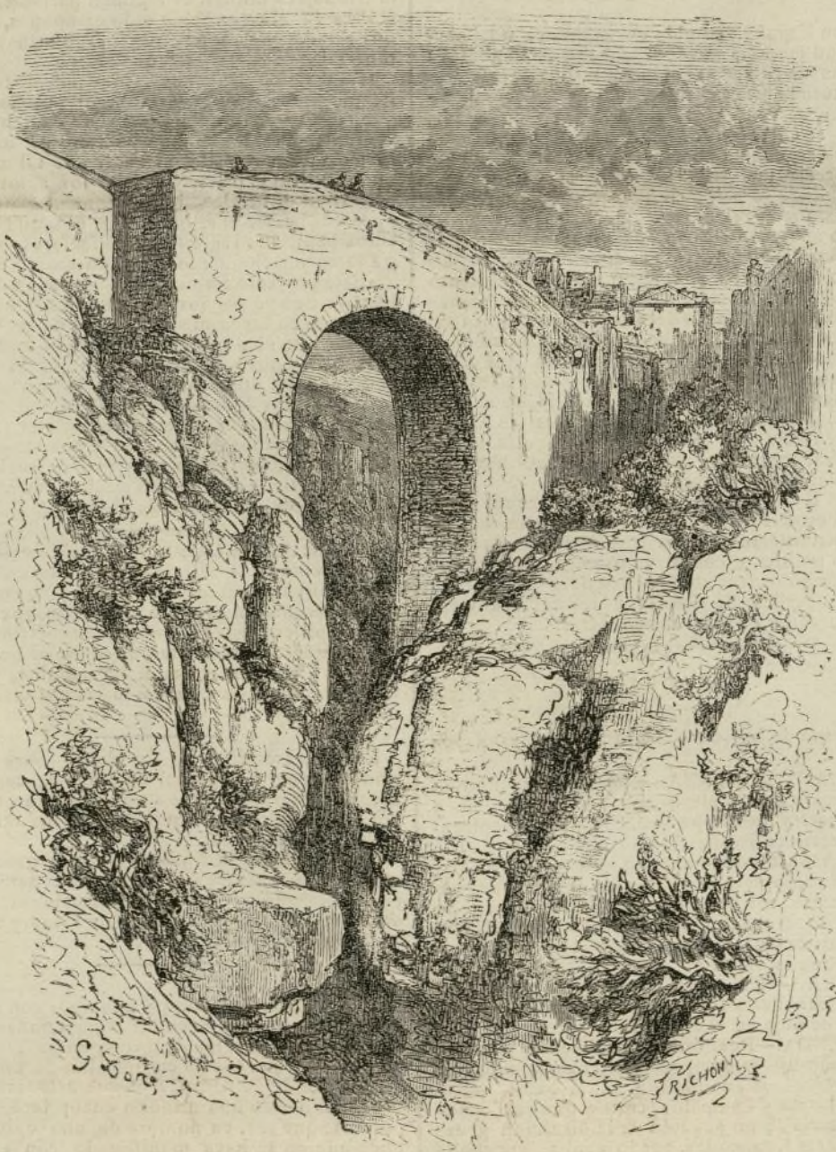
RONDA.—PRECIPICIO CONOCIDO POR EL TAJO.

El tribunal, despues de animada discusion, comparece de nuevo y el presidente da lectura á la sentencia, en la que se condena á Toussaint á un año de prision.