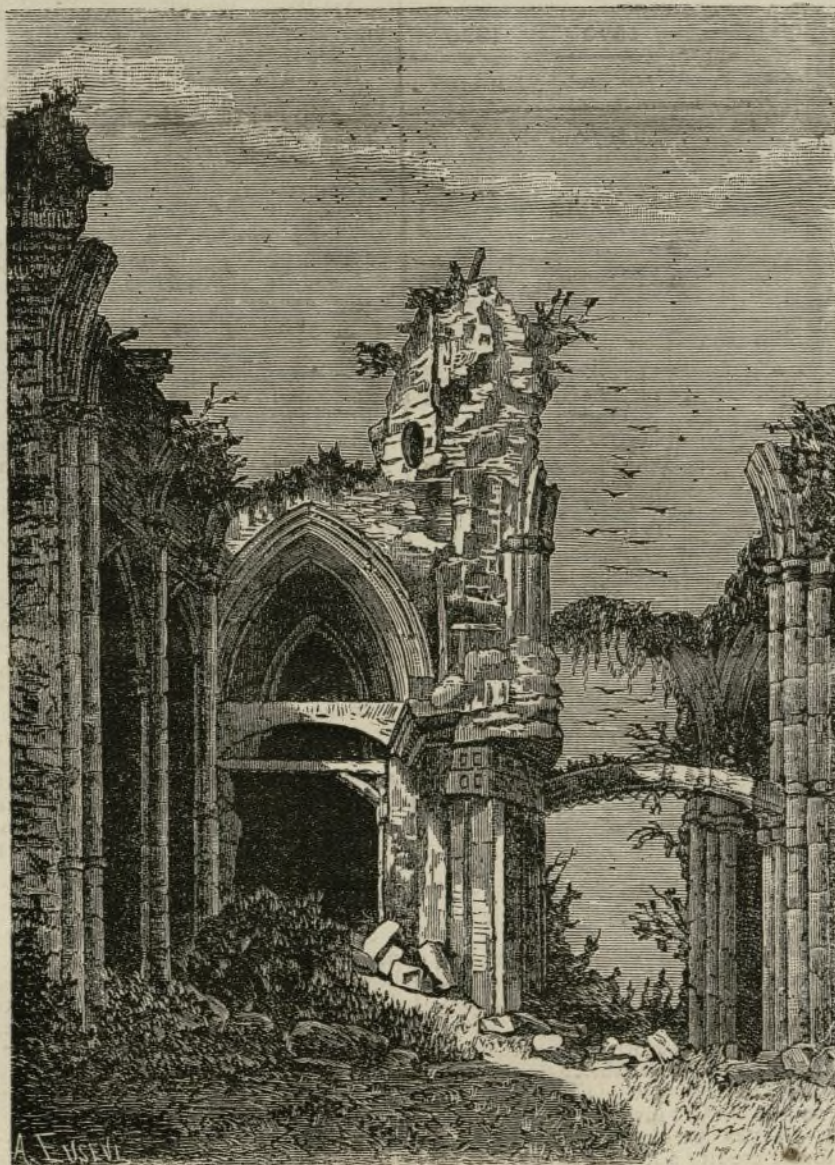
BURGOS.—RUINAS DEL MONASTERIO DE SAN PABLO