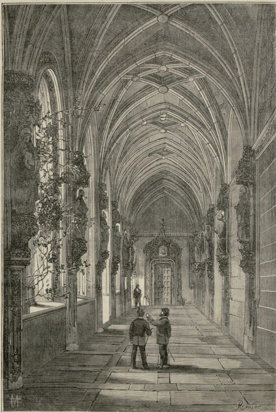
TOLEDO.—CLAUSTRO DE SAN JUAN DE LOS REYES

Tal es la condición actual de la mujer en Suecia.