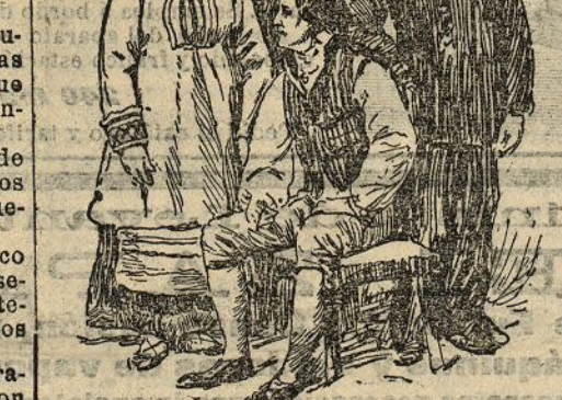
Tipos de la comarca de Riga

Los verdugos, no satisfechos sin duda con