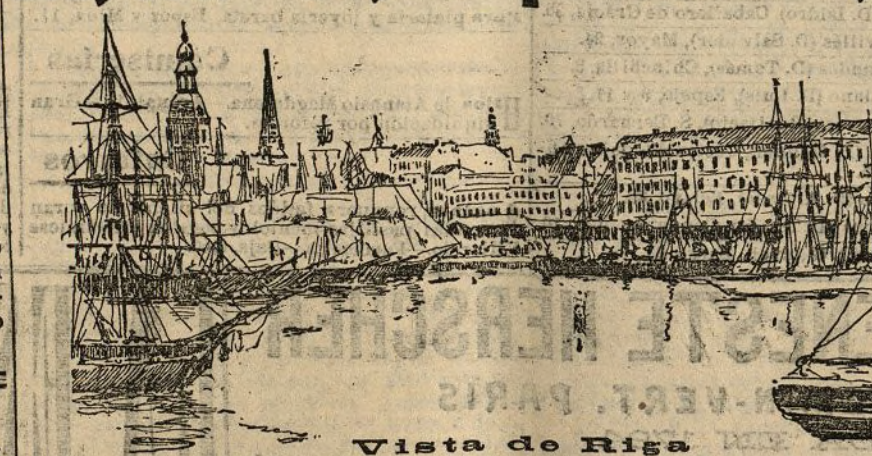
Vista de Riga

Riga es la principal de las provincias bálticas, y por el número de habitantes la capital ocupa el quinto lugar entre las ciudades rusas.