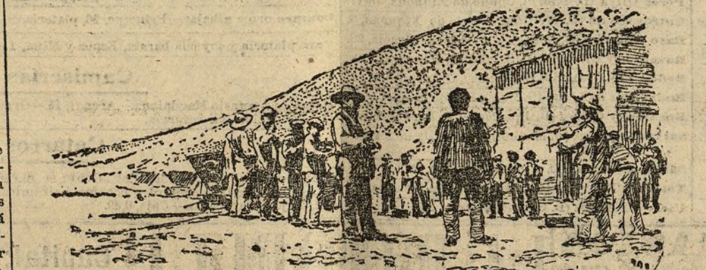
Fotografía tomada en Sierra de Gador por nuestro corresponsal en Berja, Sr. Salmerón Pellón, aprovechando este momento en que una brigada de obreros de las Minas Las Memorias y Virgen de Gador, contaban las clásicas sopas coloradas antes de empezar a trabajar.

La hora de la comida, hora hermosa de asueto, es para los mineros un oasis de minutos que hallan en el curso de sus días negros.