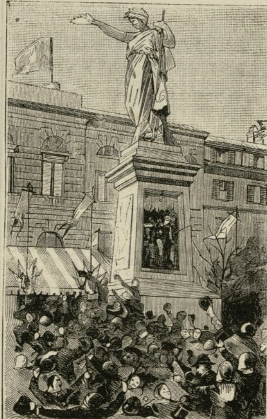
MONUMENTO EN MENTANA.—1. Episodio de Mentana.—2. Episodio de Monterotondo.—3. Símbolo de Roma.—4. Monumento completo.

La República Francesa publica un artículo de completa actualidad, en el cual se hace la historia anecdótica de los juguetes de poco precio, que en estos días de Pascuas se venden por millones en Francia, y en París particularmente.