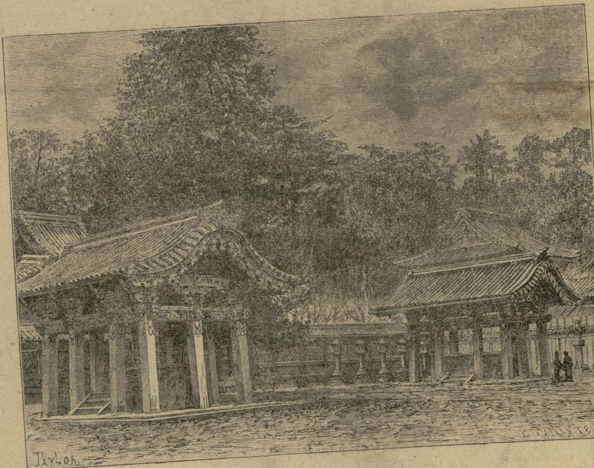
PATIO DE UN MAUSOLEO EN YEDO.

—Pues bien; no envidiéis la suerte de Mausoleo. En vuestros sepulcros, las estatuas de Budha protegen los restos de los que yacen tranquilamente bajo la tierra, y todo en ellas está dispuesto de tal