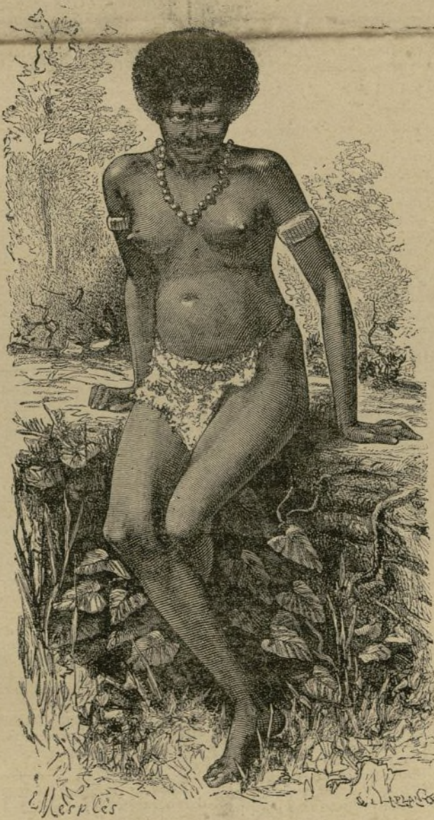
UNA JOVEN ARFAK

Alianza conyugal que no impide tomar nueva esposa cuando se marcha la belleza de la primera; no exige grandes quebraderos de cabeza, y ahí es-