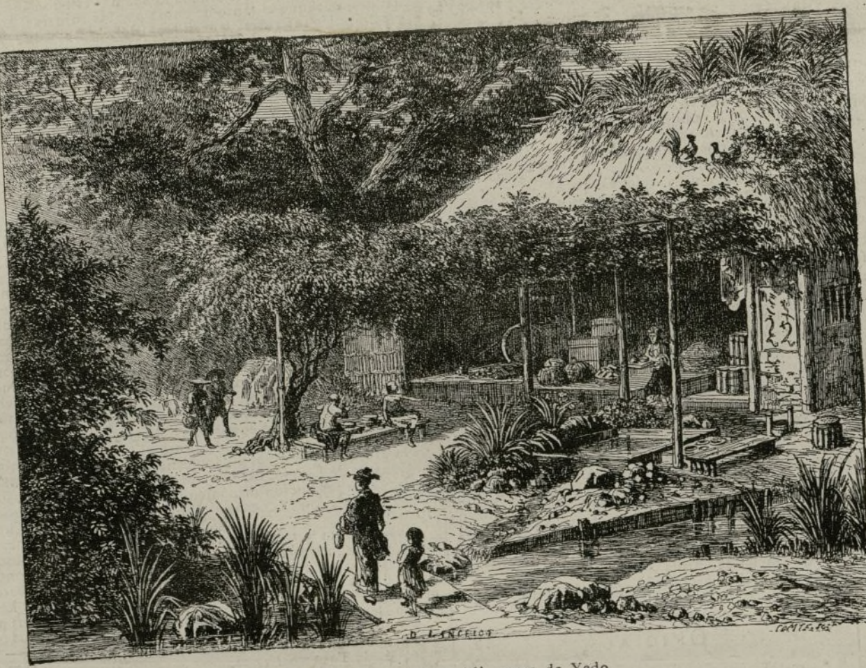
Casa de té rústica en Oji, cerca de Yedo.

La plaza de Santa Ana y sitio donde está colocada la estatua de Calderon, se iluminará tambien por un procedimiento desconocido en Madrid.