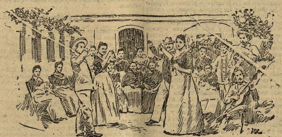
MALLORCA.—Baile de payesas

La primavera abre las puertas a las fiestas que se celebran en Mallorca, y no pasa domingo en que los pueblos no se vean concurridos para conmemorar una fiesta.