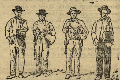
MALLORCA.—Gaiteros y tamborileros

Este es el número indispensable. Los bailes en Mallorca están muy extendidos.