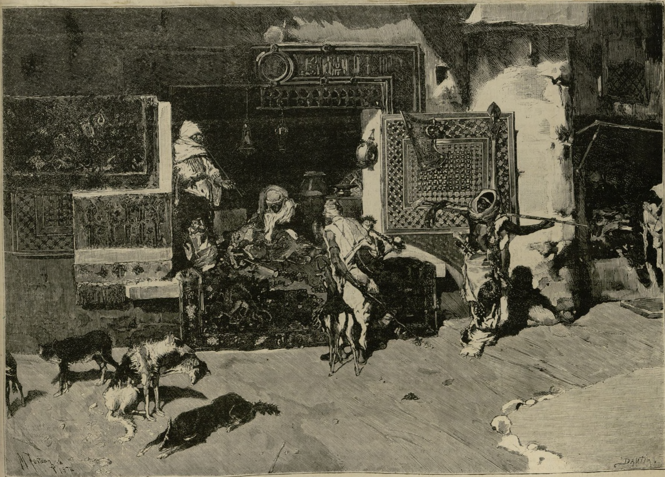
EL VENDEDOR DE TAPICES.