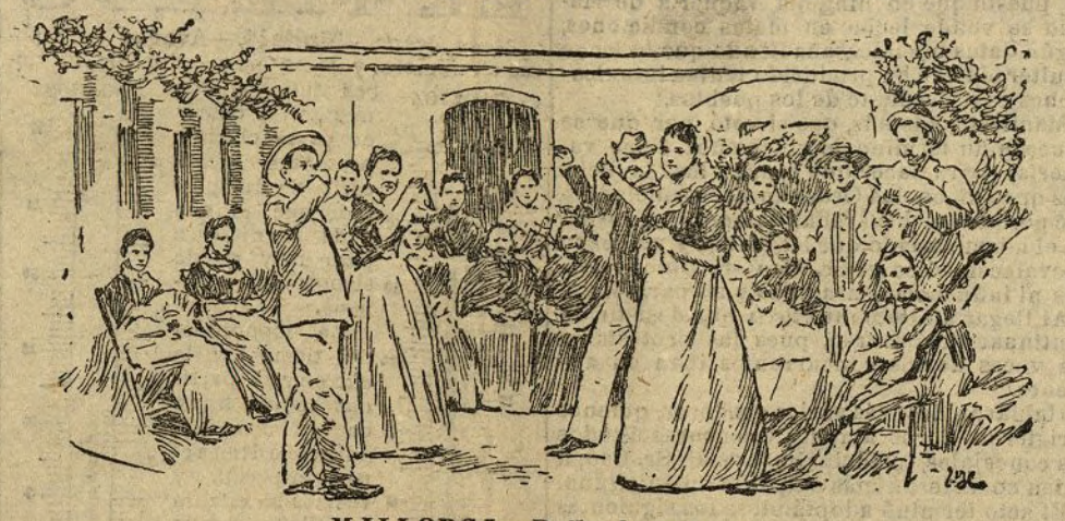
MALLORCA.—Baile de payesas

La primavera abre las puertas a las fiestas que se celebran en Mallorca, y no pasa domingo en que los pueblos no se vean concurridos para conmemorar una fiesta.