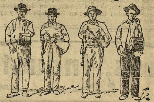
MALLORCA.—Gaiteros y tamborileros

Este es el número indispensable. Los bailes en Mallorca están muy extendidos.