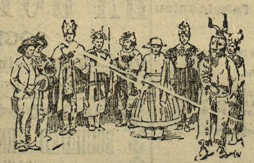
MALLORCA.—Cossies de Montuiri

Yo había oído decir que los cossies tomaban parte en las funciones religiosas. En cierta ocasión, y hallándome en Alaró, pude contemplar este espectáculo. Para ello, pues la iglesia estaba atestada, tuve que alcanzar un puesto en el órgano. Mejor sitio no hubiera podido elegir para mi propósito. Comenzaron los oficios con el ritual acostumbrado. Estaban éstos adelantados, cuando se suspenden por un momento para dar entrada a los cossies . Penetraron por la puerta principal. Entraron danzando hasta colocarse en el presbiterio. Allí efectuaron algunas