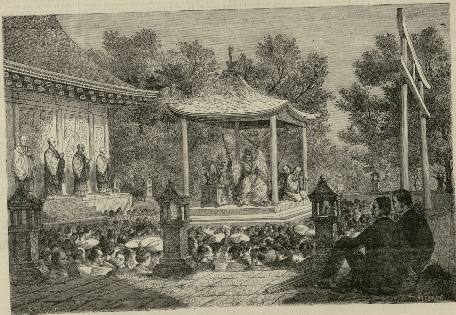
Gran templo de Yoshida.

Un sacerdote shintoita, llevando en su mano un arco, y á la espalda un carcaj lleno de flechas, empieza por dar vueltas alrededor del estrado, mi-