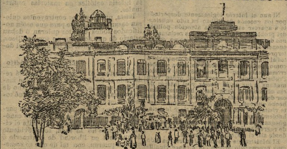
Vista del edificio después del incendio