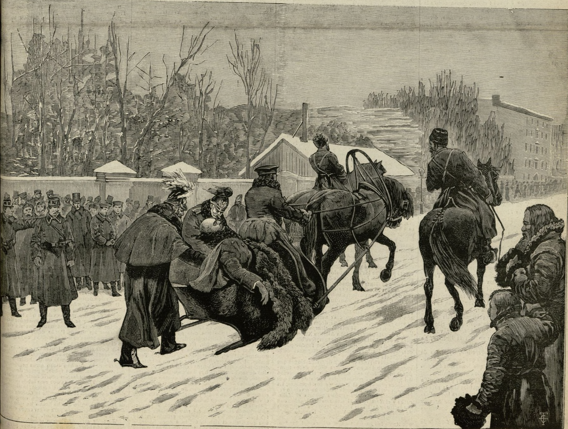
AYUNTAMIENTO DE MADRID. ATENTADO CONTRA ALEJANDRO II.—EL AYUNTAMIENTO DE MADRID CONDUCE AL CZAR Á PALACIO

Todas las decoraciones son de primer orden. A ellas se deberá que la obra figure mucho tiempo en los carteles, y que el afortunado empresario de miss Zæo recoja abundante cosecha del oro que ha sembrado para que brotase El Rosal de la Belleza .