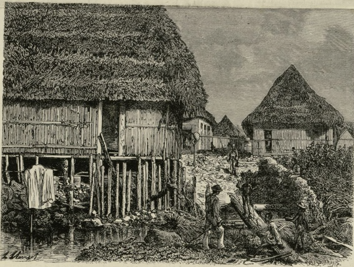
UNA CALLE DE CHAGRES

El hermano previno á la policía, y el saltimbanquis declaró que la niña le había sido vendida por un compañero suyo. La infeliz criatura había sido vendida tres veces. Se ha abierto el correspondiente sumario. El baron de X... ha caído en poder de la justicia.