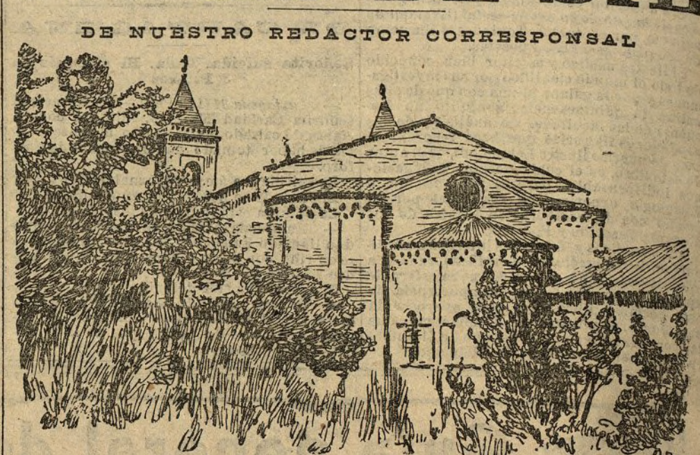
RIBAS DE SIL.—Absides de la Iglesia

No es para un solo artículo, y por consiguiente para un solo día, exhumar recuerdos históricos y escribir de preciosas artes artísticas referentes á esta riquísima provincia de Orense, la comarca de los ríos misteriosos, de las sierras foscas, de los valles olorosos y verdes como la hoja del limonero y del naranjo.