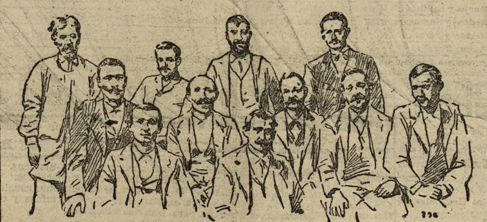
Primera Junta directiva de la Sociedad de vendedores