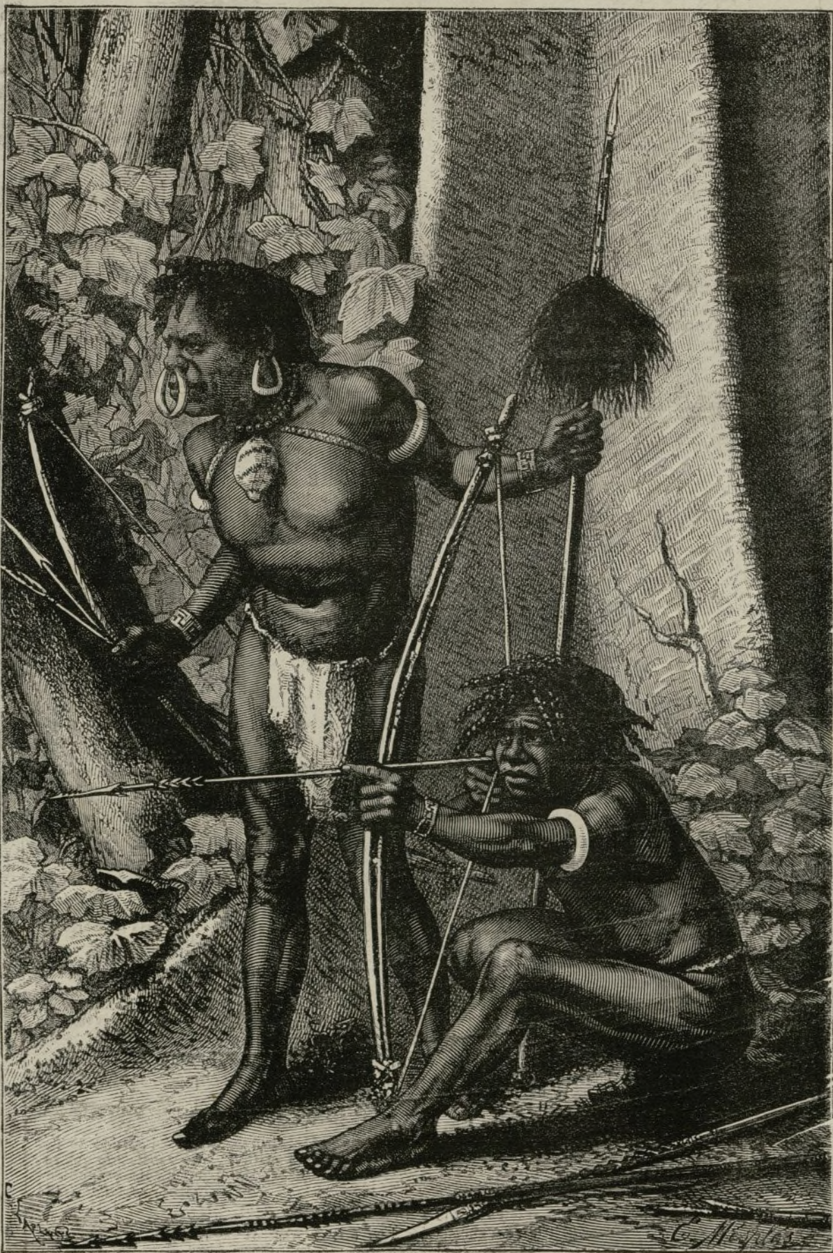
PAPÚES KARONS (ANTROPÓFAGOS)

Al fin y al cabo, el más jovencito de esos karons llevaba comidos, cuando fué retratado, la friolera de quince semejantes suyos.