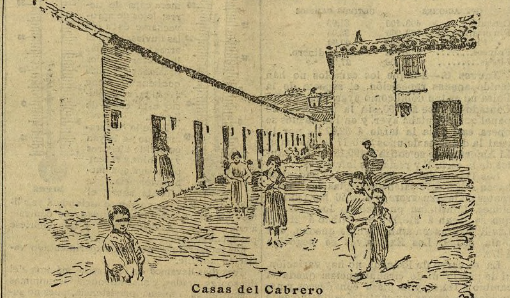
Casas del Cabrero

El próximo derribo del malogrado barrio de las Injurias, como decían los vecinos en el comunicado que publicó DIARIO UNIVERSAL, ha hecho que periodistas y fotógrafos visiten toda la zona del puente de Toledo, dejando contar al público, detalladamente lo que constituyen las afueras de Madrid.