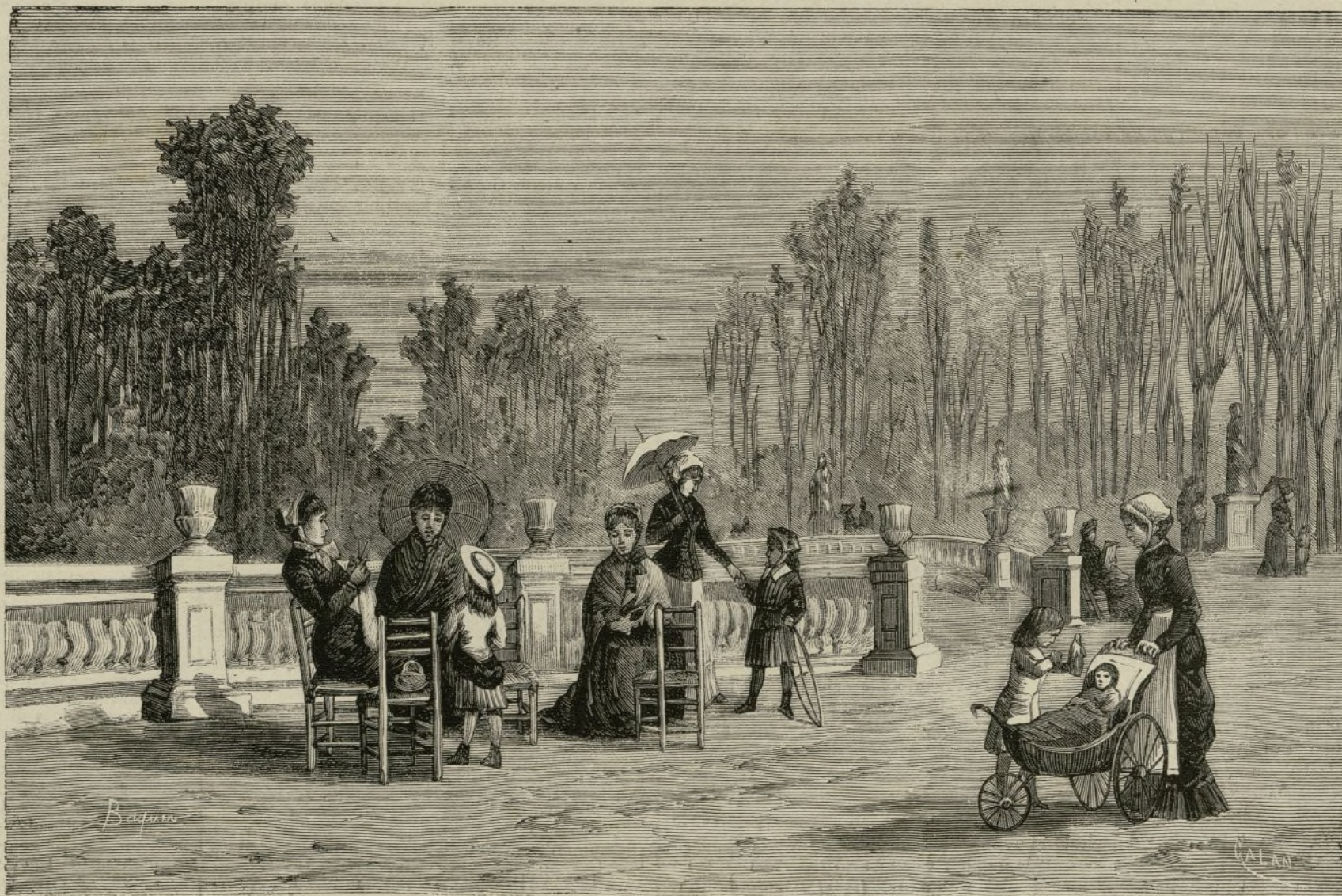
PARIS.—JARDINES DEL LUXEMBURGO

La compañía de ópera-cómica francesa que debe dar 30 representaciones en el teatro y circo de Rivas, dió ayer domingo comienzo á sus tareas. Para inauguración de esta corta temporada, puso en escena La dame blanche , ópera en que Boieldieu probó su inspiración escribiendo una música llena