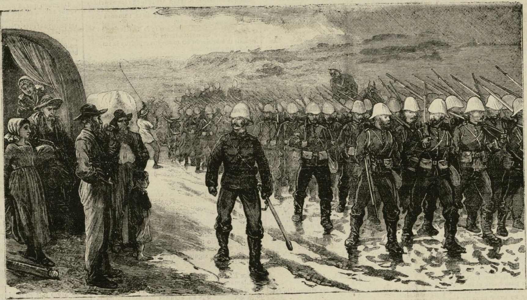
LA INFANTERÍA INGLESA EN MARCHA