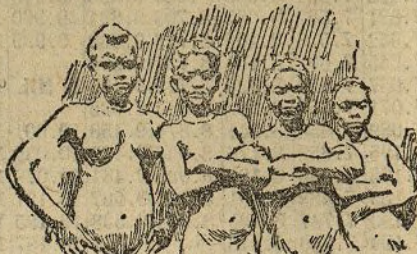
Mujeres pamperas de Bata

— ¡Bien puede usted decir que he resucitado! — contestó Valladares respondiendo a mi exclamación — porque, vengo del otro mundo... de África! (No hay que olvidar la