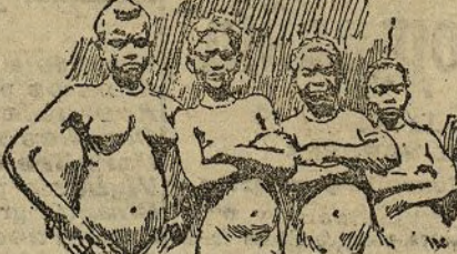
Mujeres pámides de Bata