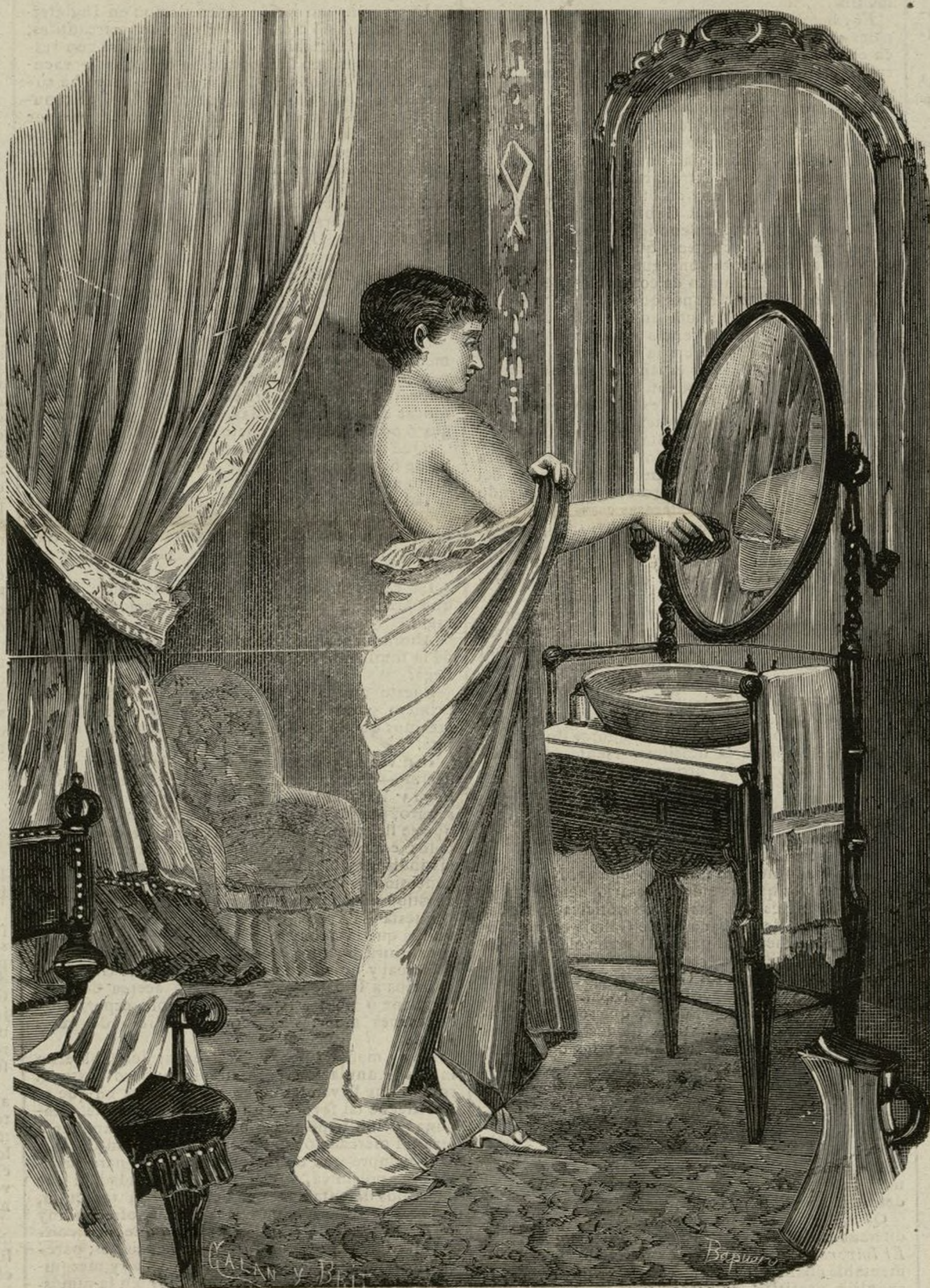
NO ESTÁ VISIBLE

Creo que nuestro grabado resuelve la cuestión y señala la hora de resolver ese peliagudo asunto. Si están mejor ó peor con moño que sin él, ya está visto.