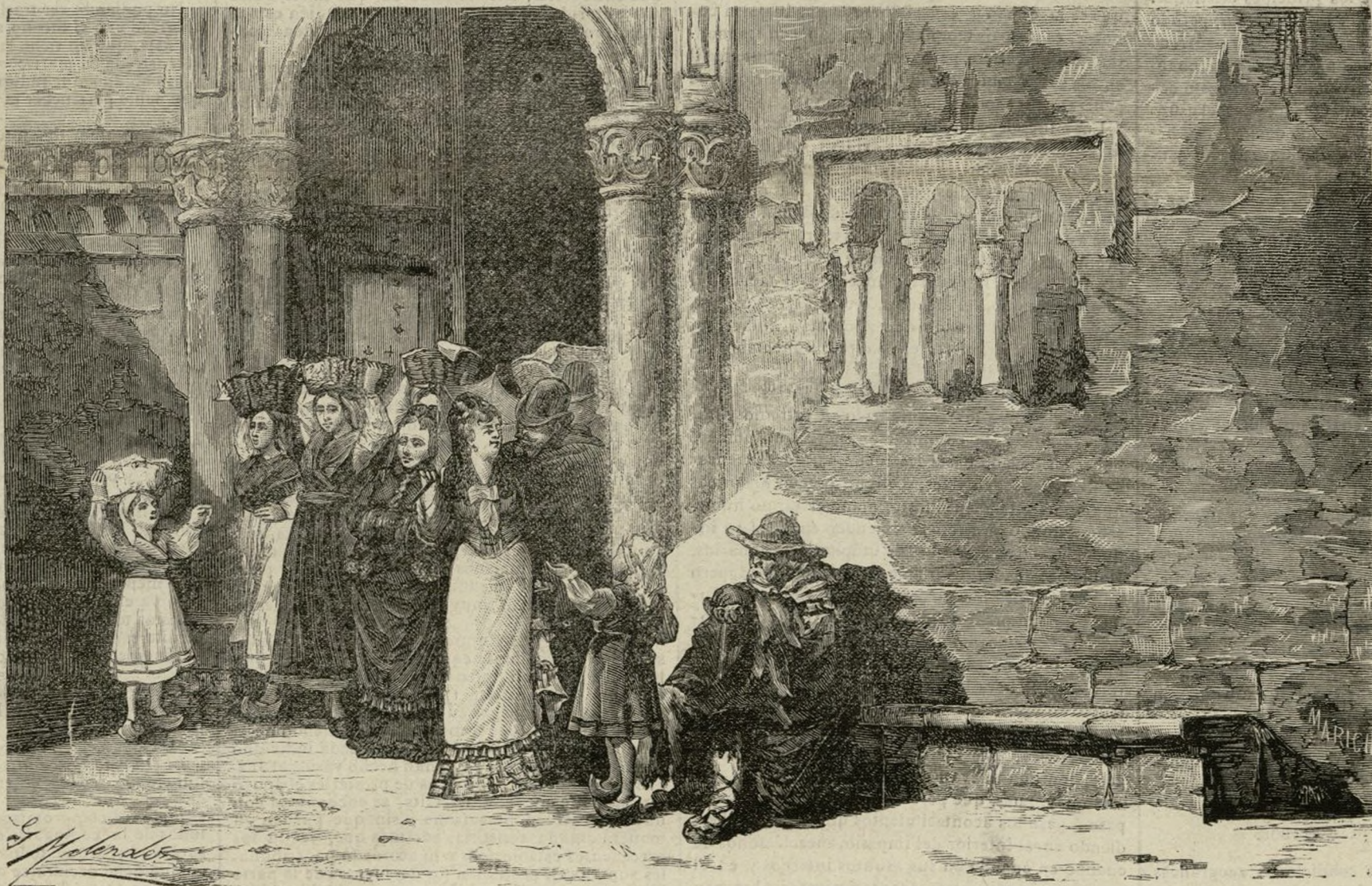
ASTURIAS.—LA SALIDA DE MISA EN LA COLEGIATA DE GIJÓN

Es una escena de la vida de provincia, que por su novedad y su riqueza de detalles encanta y atrae á los que estamos lejos de esa tranquila y pura atmósfera.