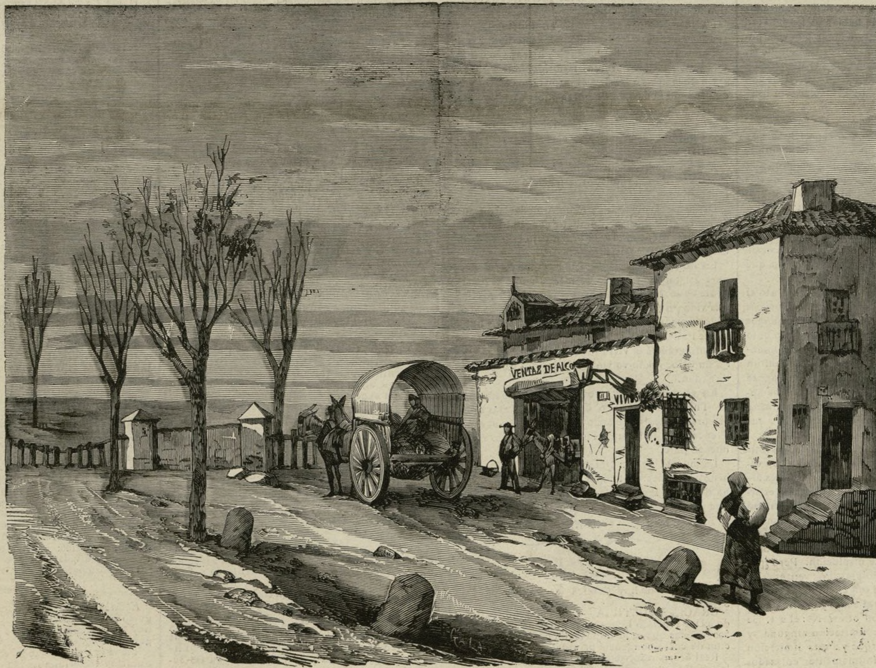
CERCANÍAS DE MADRID.—LAS VENTAS DE ALCORCON

Delante de una mesa de pino, cubierta con un mantel en ocasiones del mismo color de esta madera, y en cuyo centro humea la nunca bastante bien ponderada fuente de callos, hombres y mujeres, ellos dotados de esa hermosura varonil y pro-