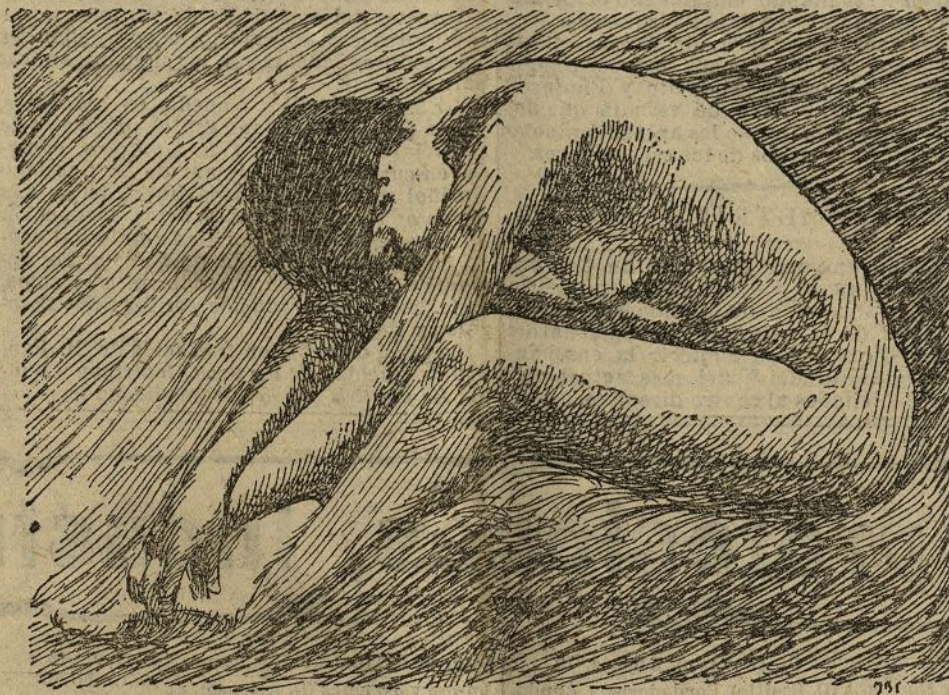
Una academia.—Reproducción de una goma de Walter