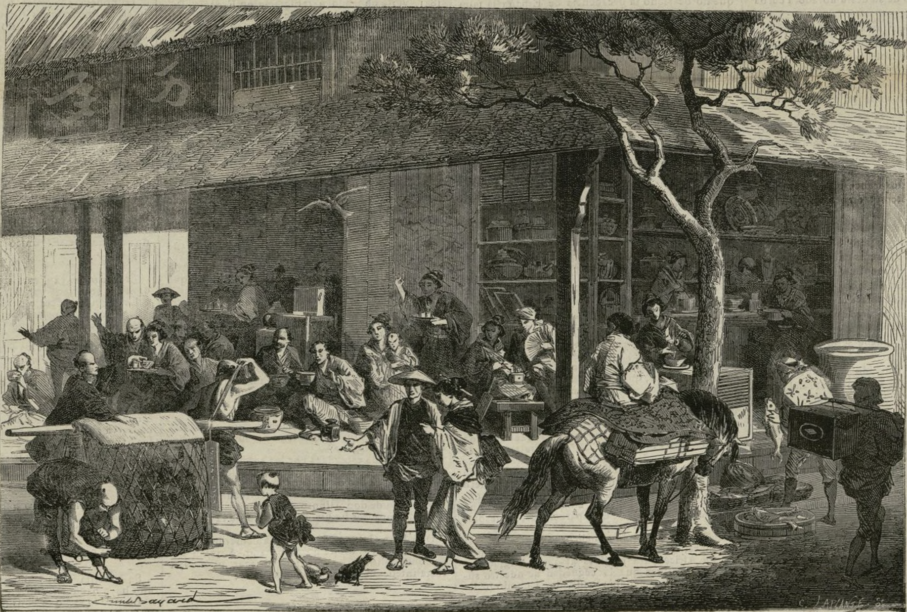
UN ESTABLECIMIENTO Ó CASA DE TÉ EN EL JAPON

Acaso parecerá extraño que un pueblo perteneciente á una raza que se ha distinguido y se distingue en la historia por la inmovilidad y estabilidad de sus costumbres é instituciones, abandonase tan pronto y tan fácilmente los trillados senderos de la tradición para emprender un nuevo género de vida; pero semejante extrañeza desaparece si consideramos atentamente las condiciones de carácter del pueblo japonés.