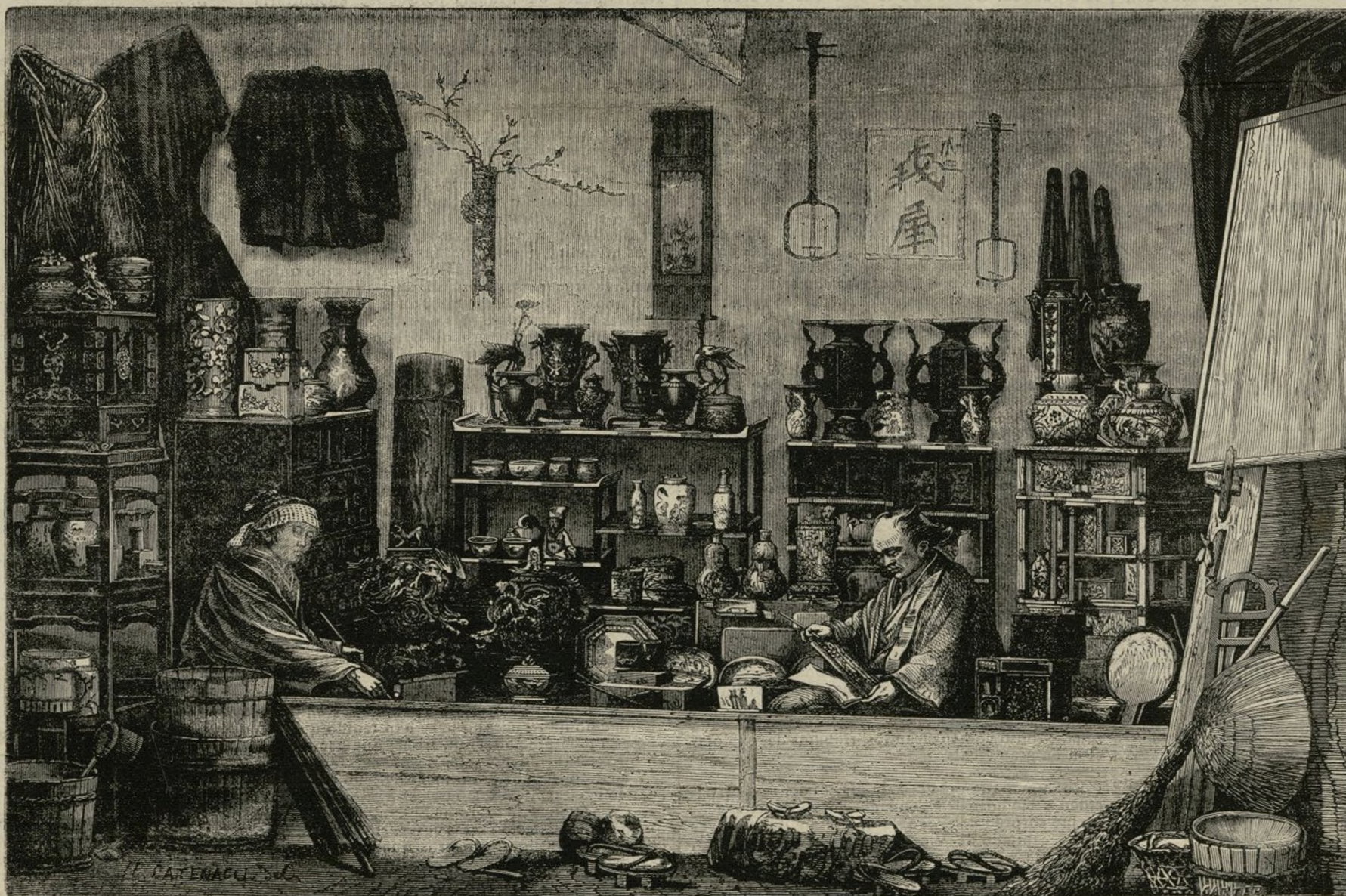
COMERCIO DE CURIOSIDADES EN YOKOHAMA.

No hay nada tan vivo, tan lleno de colorido, delicado, variado, caprichoso y alegre, como las composiciones que los japoneses producen en este género. En ellos despliegan una fecundidad de imaginación, un sentimiento de la naturaleza y al mismo tiempo una fantasía verdaderamente extraordinarias. Sus porcelanas dejan atrás por la delicadeza y elegancia de su decorado á los mejores producto