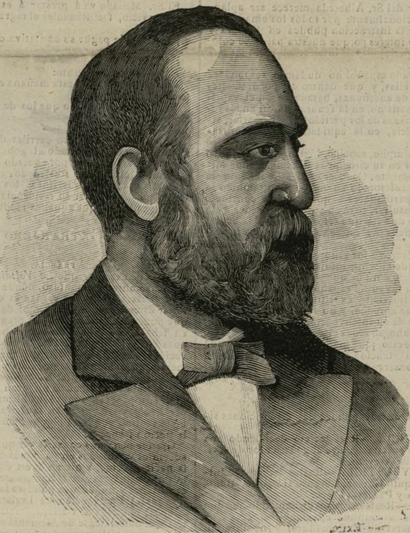
JAMES ABRAHAM GARFIELD.

El que de tan bajo llega hasta tan alto, prueba bien su valer, y lo que Lord Garfield vale, lo prueban su oscuro nacimiento y su elevación actual.