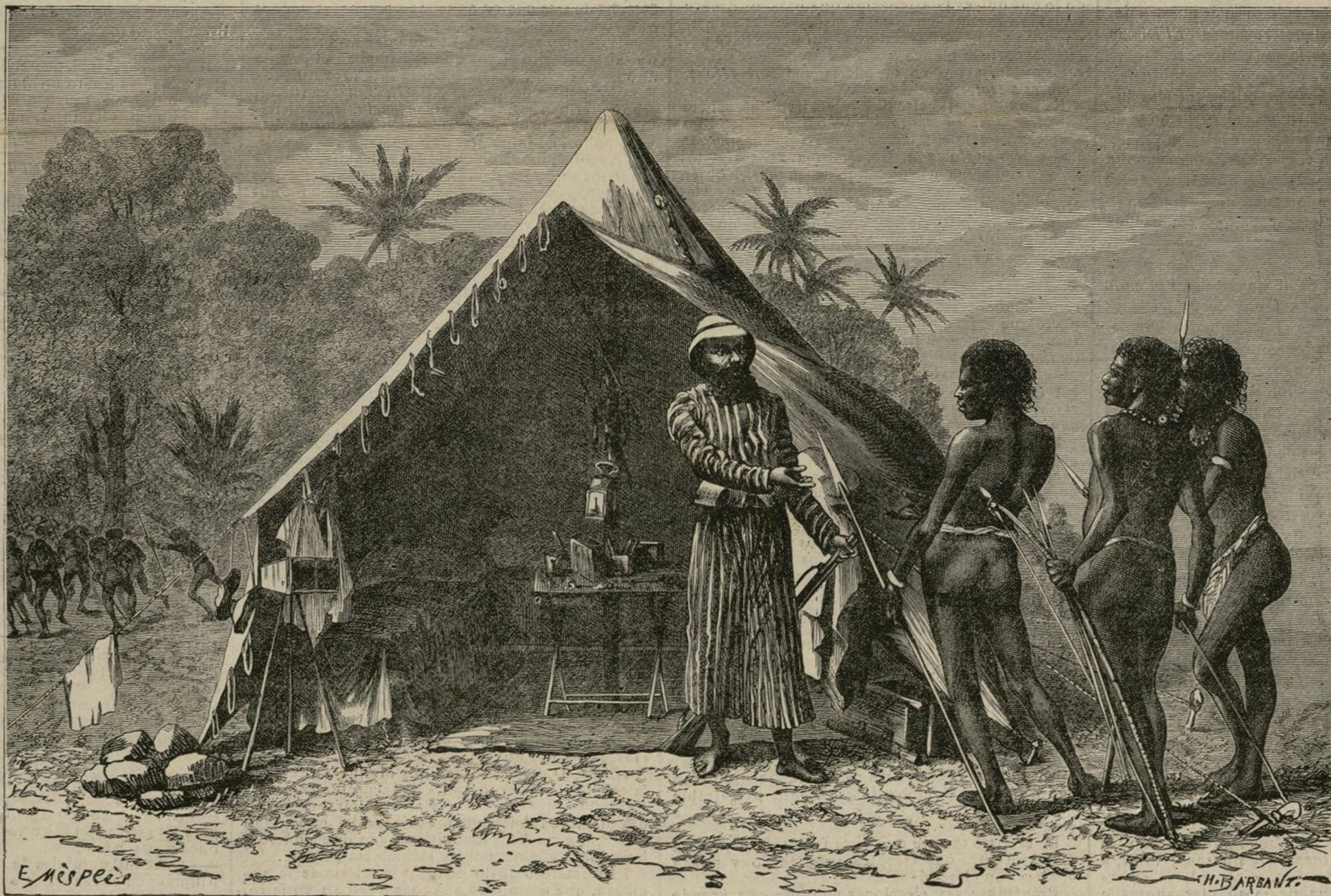
PIRATAS BIAKS EN LA ISLA MAFOR

El ilustre viajero francés, M. Aquiles Raffrey, que fué comisionado por el Gobierno de su país para hacer un viaje científico á aquellas apartadas regiones y á quien debemos la descripción de la isla Mafor y otras inmediatas, así como cuantas noticias tenemos sobre las razas que las pueblan, refiere que hallándose en la isla Mafor, llevando á cabo