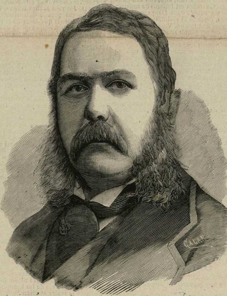
EL VICEPRESIDENTE CHESTER ARTHUR

A su regreso de Italia, y al ver aquellas hermosas flores blancas de que estaban cubiertos los ar-