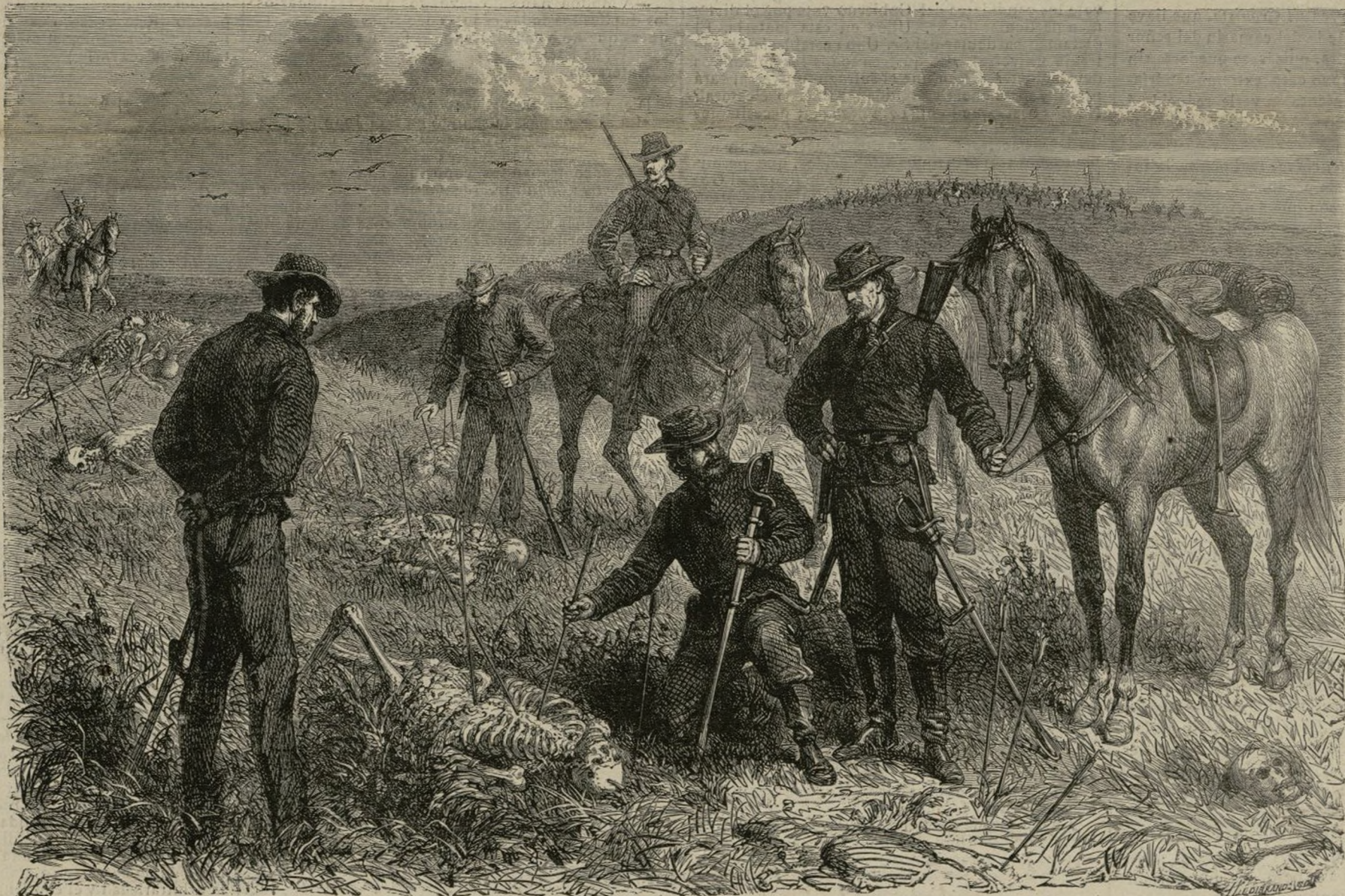
SOLDADOS DE UN REGIMIENTO DE CABALLERIA AMERICANA

Por otra parte, los indios, como es lógico, atendida su natural fiereza, toman, cuando la ocasión es propicia, revanchas terribles, porque ellos no desconocen la malevolencia de que son objeto, y además, que su vida errante y degradada exige el