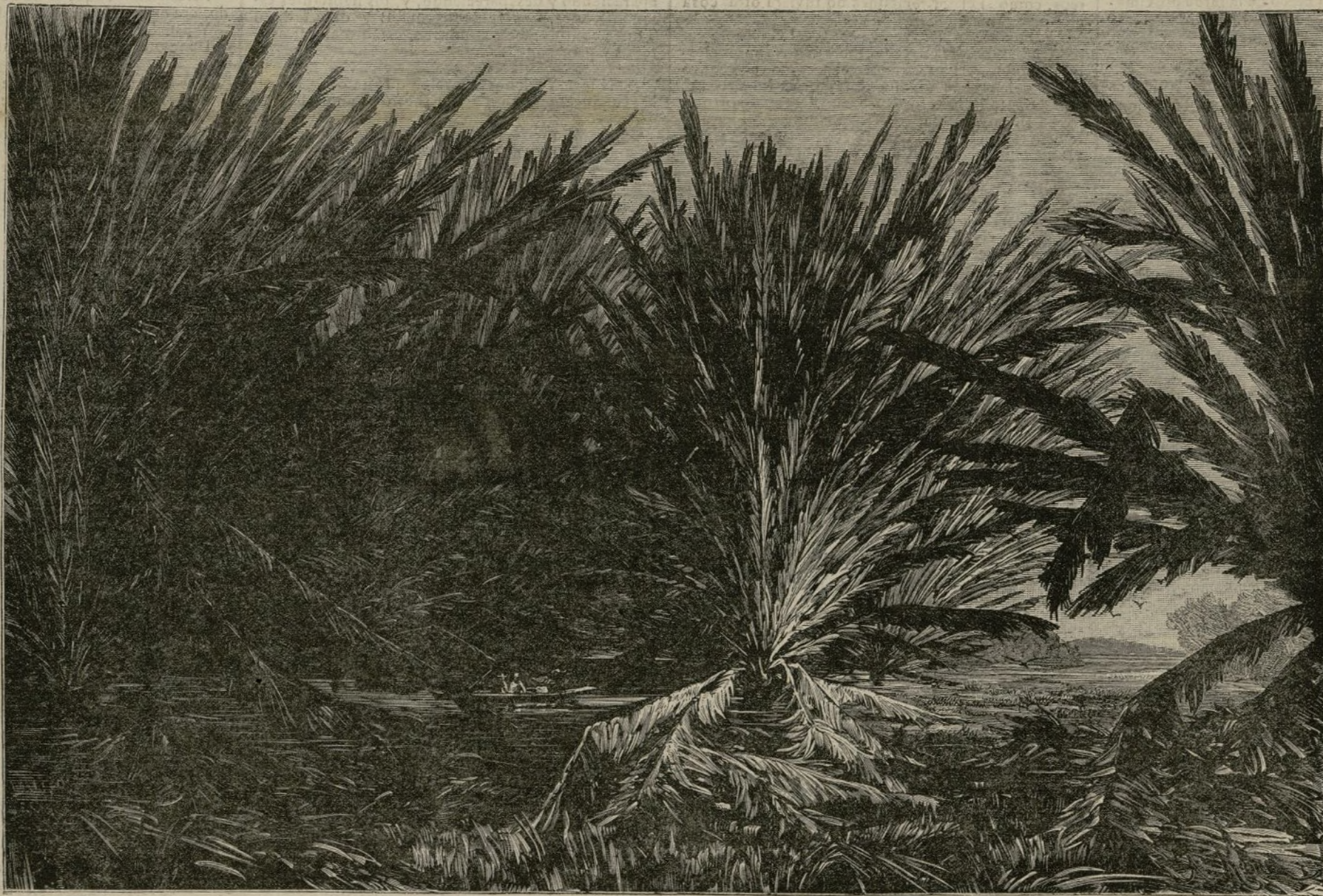
PANTANOS DEL ATRATO

El rio Atrato se tiende como una cinta de plata sobre un verde y extensísimo lecho, adornado con flores y frondosas plantas. Parece un mónstruo vi-viente que se agita convulsivo, como buscando objeto deseado, y que tiende hacia el Sud uno de sus brazos en busca de maravilloso grupo de loza-nas y verdes plantas, que semejan encantado jar-din sembrado sobre inmenso tiesto de plata. Una porcion de este grandioso conjunto de flores, jun-