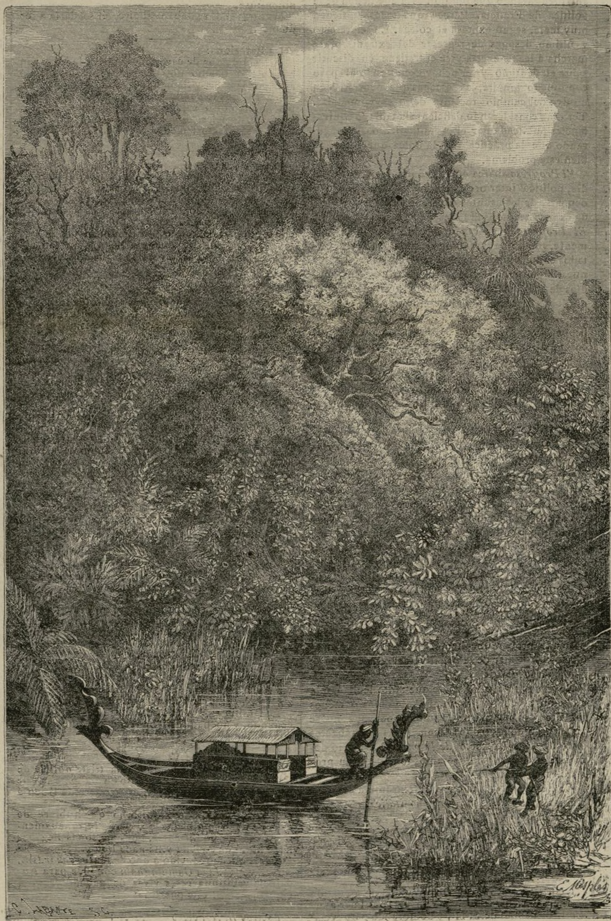
LA RIA DE DODINGA

Es de notar en el ejército holandés, que se halla compuesto de hombres y mujeres todos revueltos, aunque las mujeres no suelen entrar en las batallas, pero acompañan á sus amigos y se hallan nu-