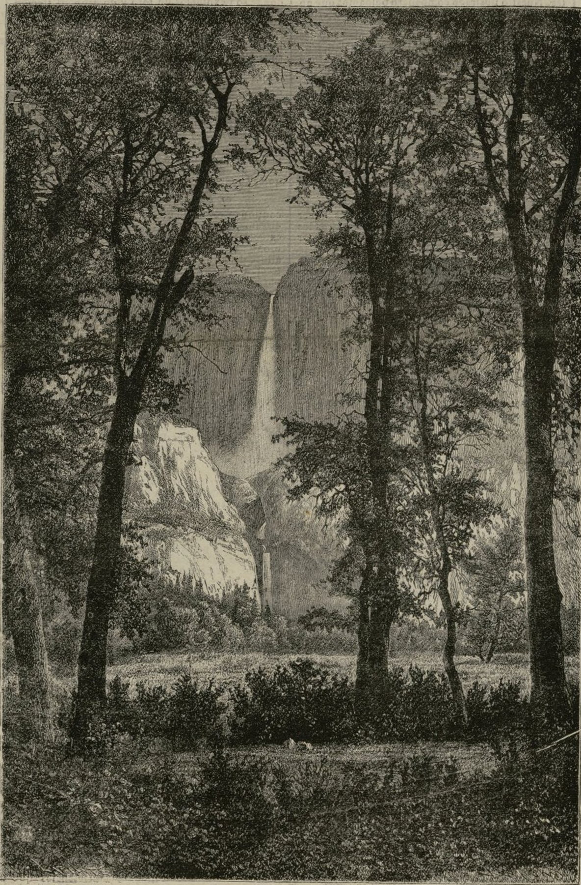
CASCADA DE YOSEMITI

El paisaje que forma la naturaleza en los alrededores del Yosemite, es en extremo agradable y pintoresco. Altísimas sierras, todas dominadas por las blancas y resplandecientes cimas de Sierra-Nevada, que reverbera la luz del sol, quebrándola en múltiples direcciones y formando graciosos cambiantes, que vienen á pintarse sobre la superficie del lago; un extenso y fecundo valle, recorrido por multitud de arroyuelos y sembrado de bellísimas