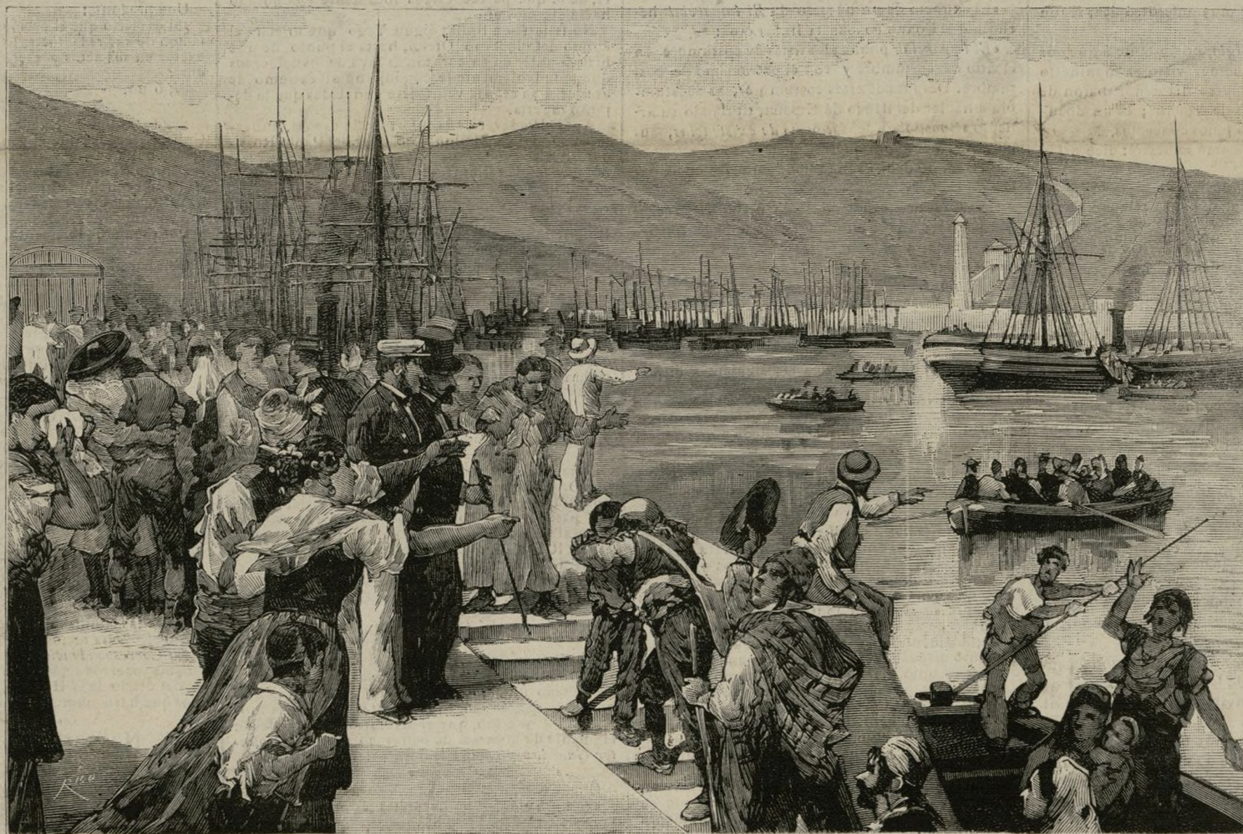
ALMERIA.—Llegada de los fugitivos de Oran que trasportó el vapor Victoria el 14 del pasado

Si el atraso intelectual, ó por mejor decir, el degeneramiento de razas, un día dominante bajo la fuerza de su ilustración relativa, puede justificar