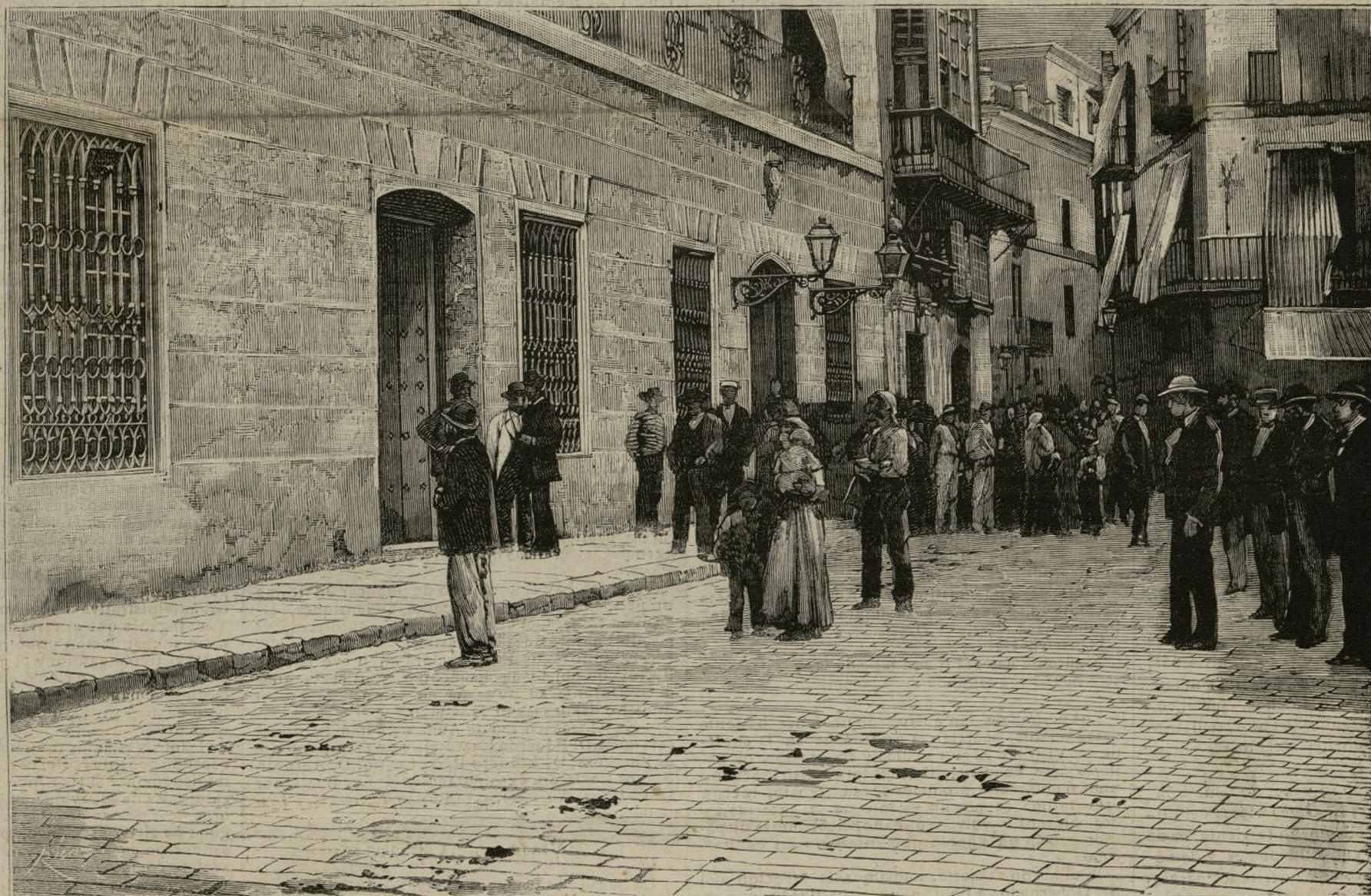
CARTAGENA.—Exterior de la Casa-Ayuntamiento durante la distribución de socorros á los repatriados

Precisamente los últimos despachos diplomáticos prueban estos asertos y la cordialidad que afortunadamente reina entre ambos países, y viene á dar un mérito á ciertas escitaciones cuyo origen desconocemos.