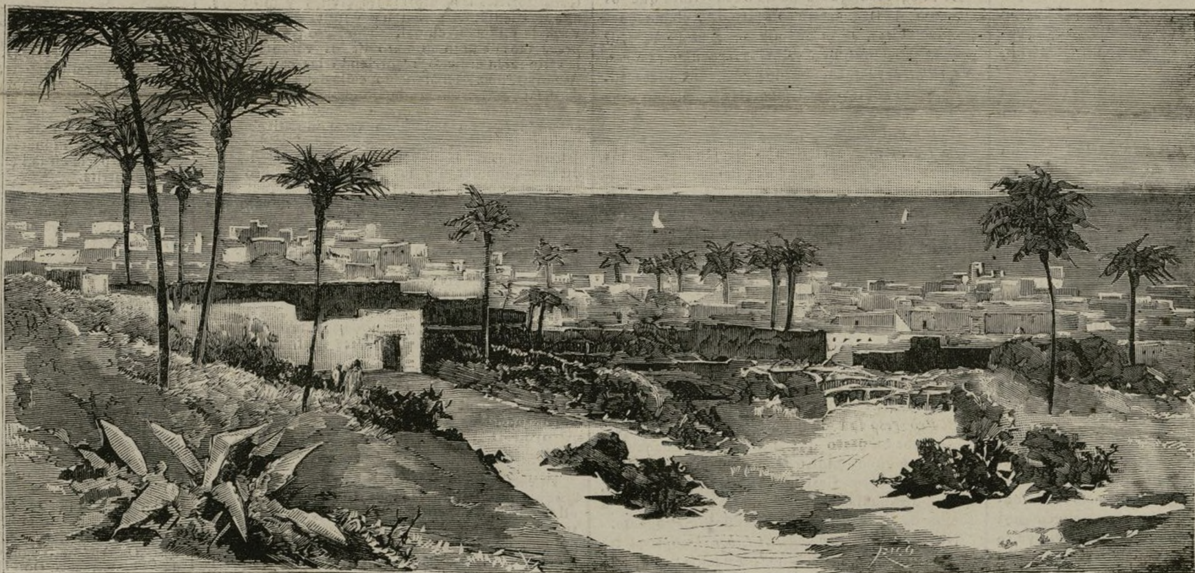
TÚNEZ.—Vista de Gabés, foco de la insurrección tunecina

Segun los últimos despachos, el jefe de las fuerzas mandó desarmar inmediatamente á todos los habitantes de la ciudad y sus cercanías, y poner en libertad los prisioneros guardados como rehenes, pidiendo además una indemnización de quince millones de pesetas, y la responsabilidad efectiva de toda la población de Sfax.