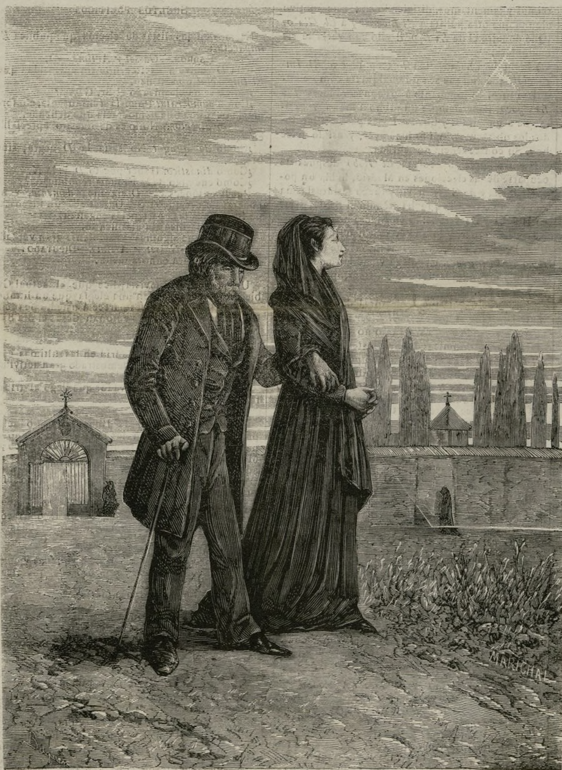
Volviendo del Campo-santo.

Estos visitantes los comprendemos y admiramos; el verdadero sentimiento se expresa sin necesidad de testigos: las visitas á los cementerios en días cualquiera las concebimos, respetamos y alabamos.