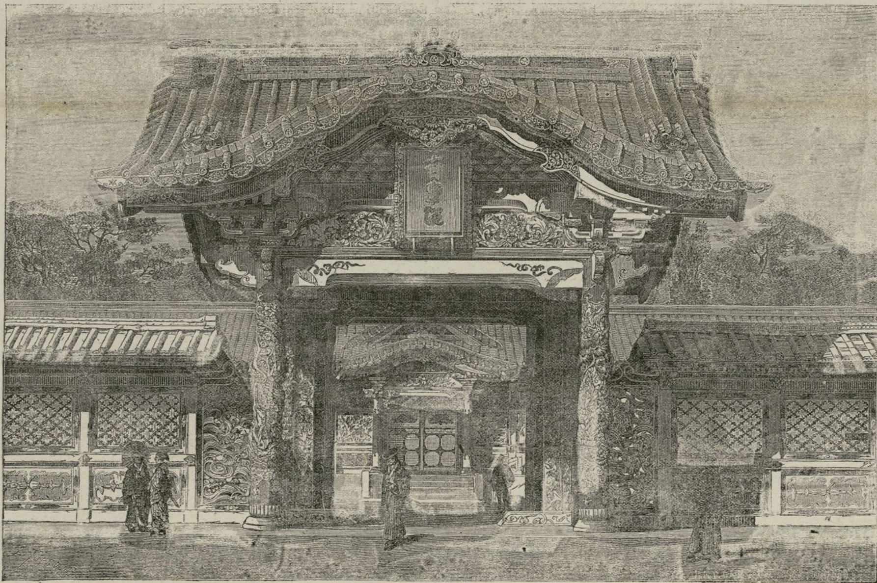
Casa de recreo del Khan de Tastavia

El gran Khan que la noche precedente estuvo ocupado hasta muy tarde, en lo que ahora no viene á cuento, se acaba de levantar, y después de ponerse las babuchas, medita entre si almorzar