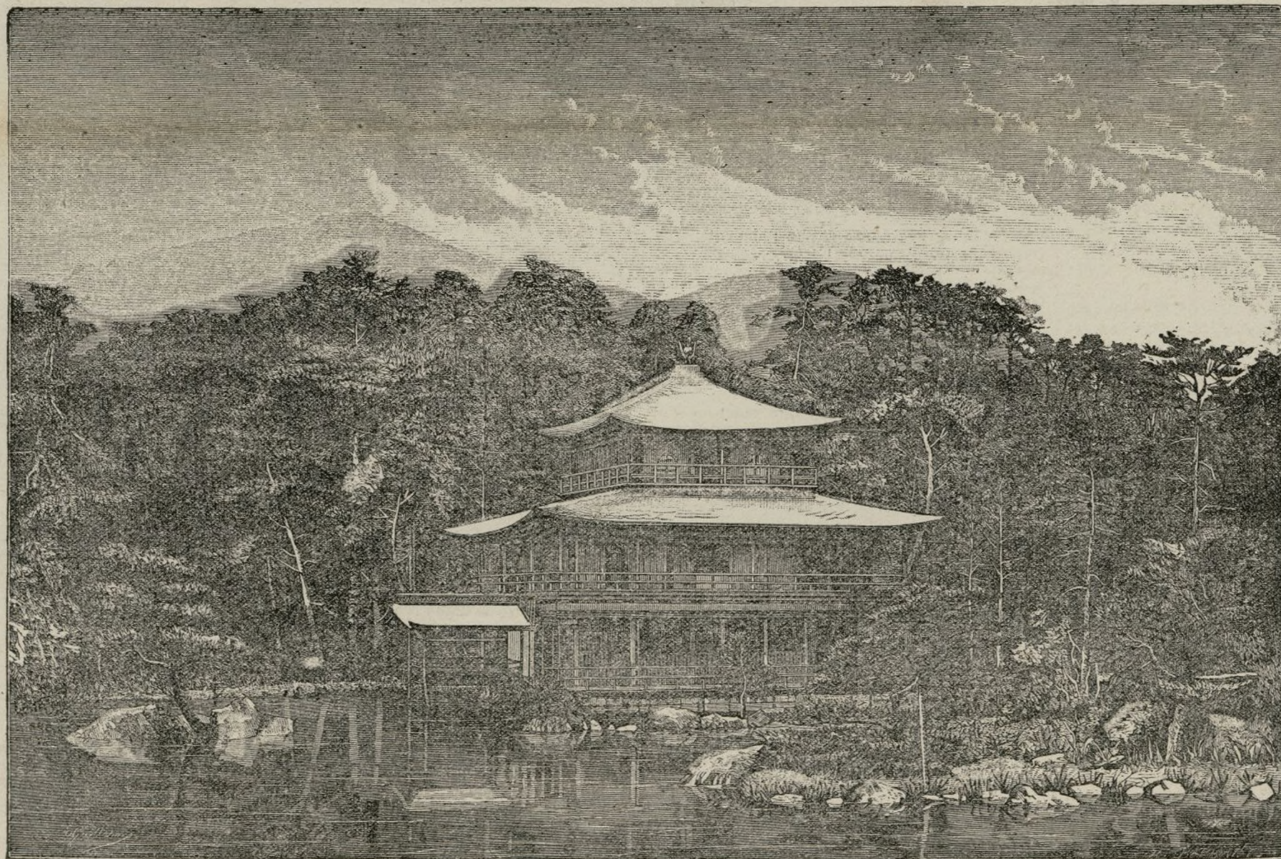
UN NIDO DE AMORES

Allí está el petit Chateau , donde puedes vivir sin